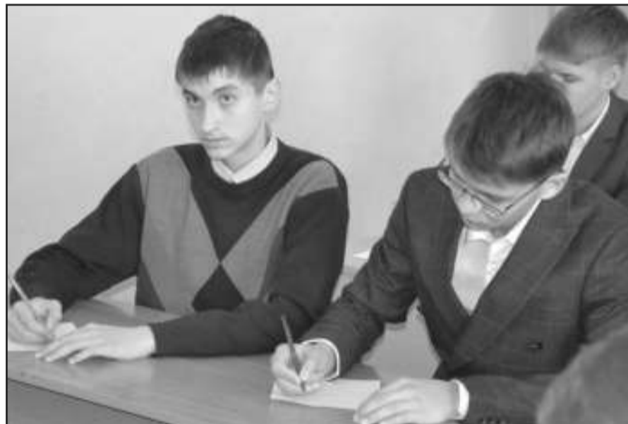
Старшеклассники на внеклассном мероприятии.

зали о том, что почерк человека строго индивидуален и зависит от состояния психики, возраста, характера, половой принадлежности, вида деятельности. Все эти особенности изучает наука графология. Специалисты-графологи без ошибки могут определить основные черты человека, написавшего тот или иной текст. Именно поэтому се-