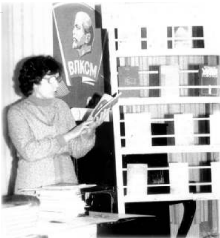
Тематическое мероприятие обсуждения книг.

С восторженностью вспоминает юбилейша и культпоходы