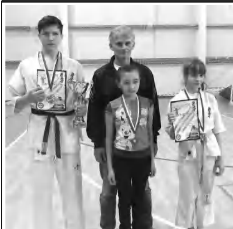
5 февраля в городе-герое Волгограде в ФОК «Альянс-Баскет» состоялись соревнования по киокусинкай, посвященные Дню воинской славы России – разгрому советскими войсками немецко-фашистских войск в Сталинградской битве.