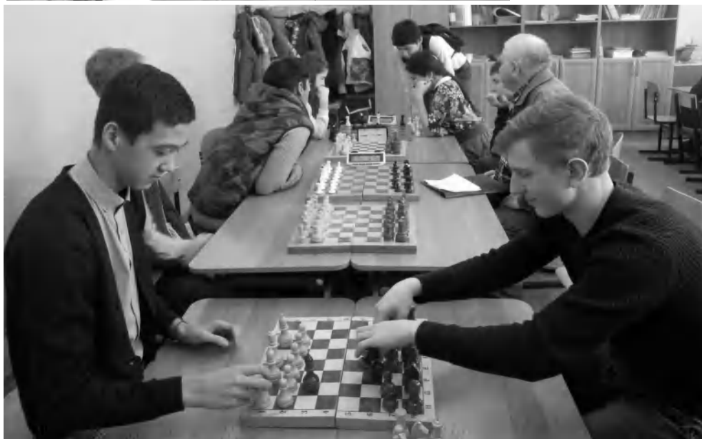
Страницу подготовила Анастасия Гладкова