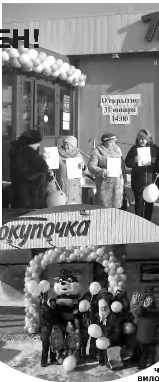
Желаем всем жителям п. Приморск и р.п. Быково стать постоянными клиентами магазина «Покупочка». Ведь выбор очевиден!

Можно долго перечислять, что предлагает «Покупочка», но лучше самим один раз увидеть и оценить весь тот богатый ассортимент, который здесь представлен. Но не только широкий ассортимент и высокое качество обслуживания заставляют покупателей прийти именно в этот магазин, самое главное - это низкие цены!