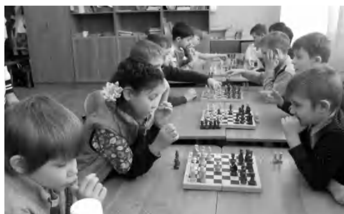
4 февраля в Быковской средней школе №3 состоялся районный шахматный турнир, посвященный 74-й годовщине победы советских войск в Сталинградской битве.

Шахматный турнир стал запоминающимся для школьников, они повысили мастерство и среди участников выявились сильнейшие спортсмены в этом интеллектуальном виде спорта.