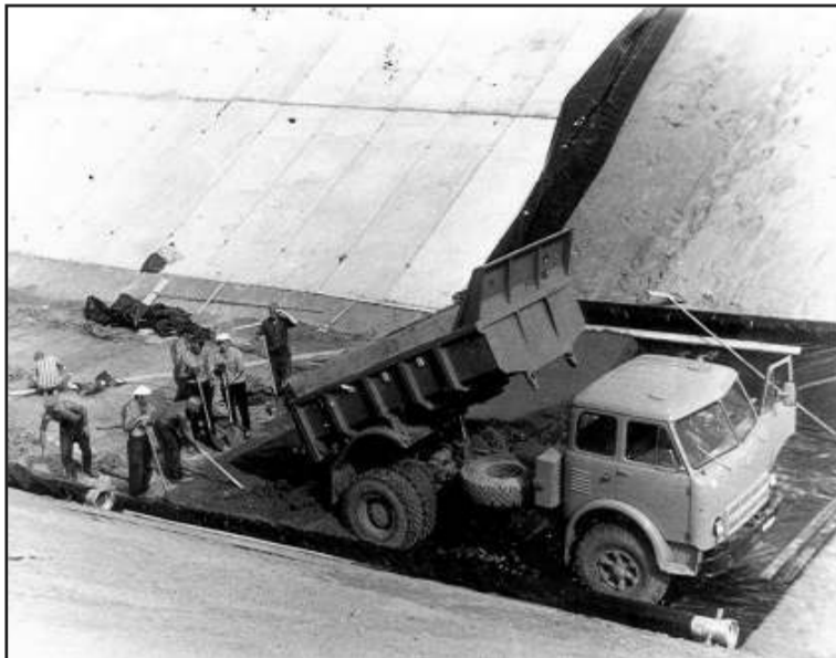
Строительство Кисловской оросительной системы.

сплошной строительной площадкой. Бурились скважины, здесь же ставили водонапорную башню с водоразборной колонкой, а для подъема воды ставили у скважины ветряной двигатель. Воду по дворам носили на коромыслах в ведрах. Подъезжать к водоразборной колонке на подводах и машинах категорически запрещалось.